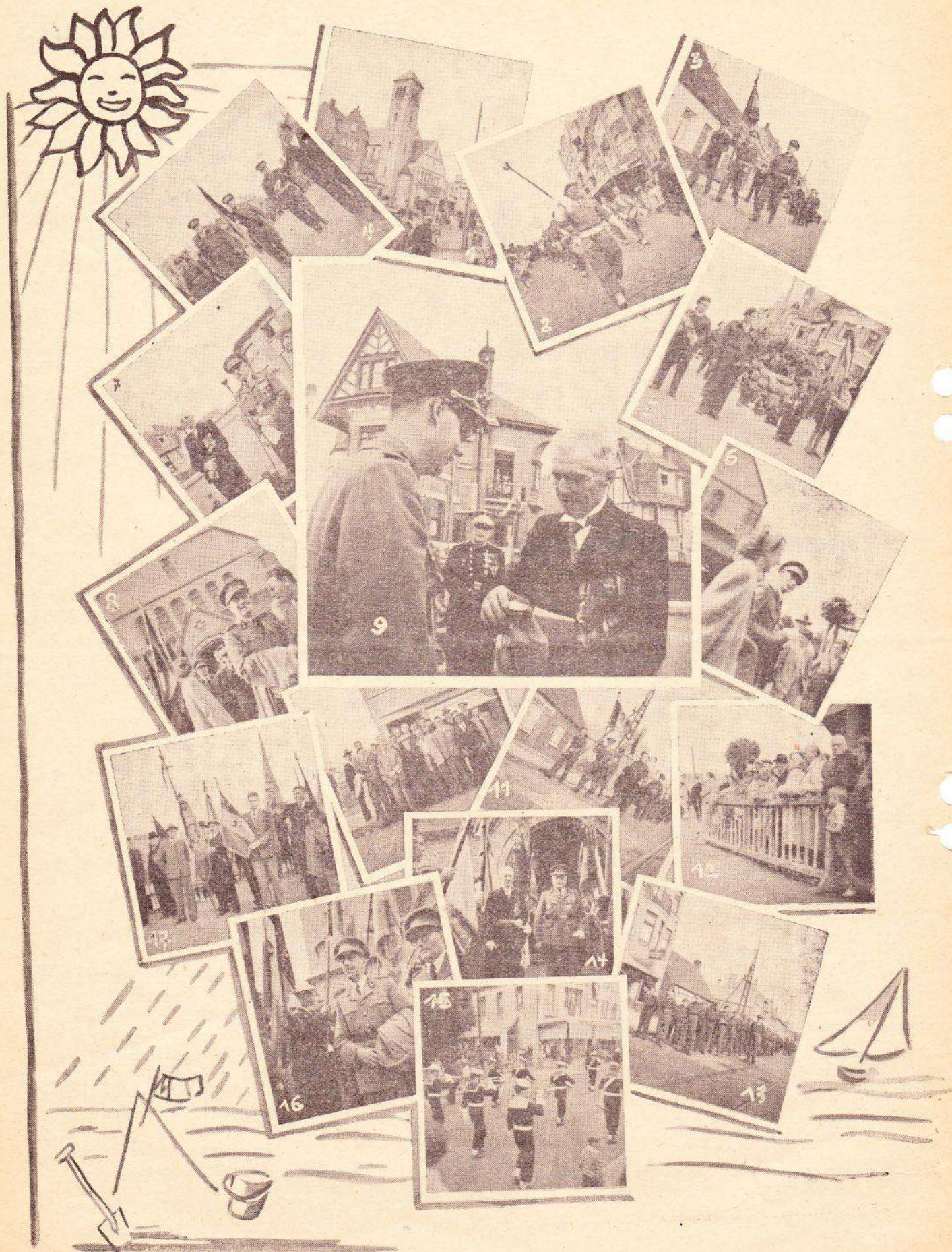
1. Eglise de La Panne. — 2. Harmonie de Mouscron. — 3. Fanion 2e Bataillon. — 4. Drapeau de la Fraternelle. — 5. Couronne — 6. Marraine et Cdt Vander Heydt. — 7. Major Samijn. — 8. Major Porrewijck. — 9. Lt Compère. — 10. Groupe d'Anciens. — 11. Fanion 1er Bataillon. — 12. La Foule. — 13. Détachement. — 14. Lt-Général Van Strijdonck de Burkel. — 15. Musique Force navale. — 16. Général Sevrin. — 17. Drapeaux des délégations.