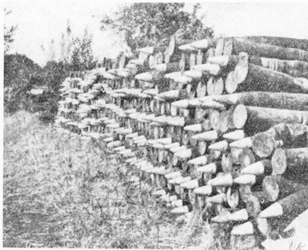
Een gevaarlijke oogst.