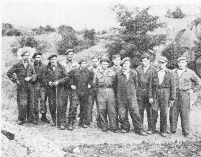
Manen en gegradeerden verbroeders : een « fameuse » ploeg

De munitie moet nog gesorteerd worden en een massa zal nog, gepaard met oneindige veiligheidsmaatregelen, ter