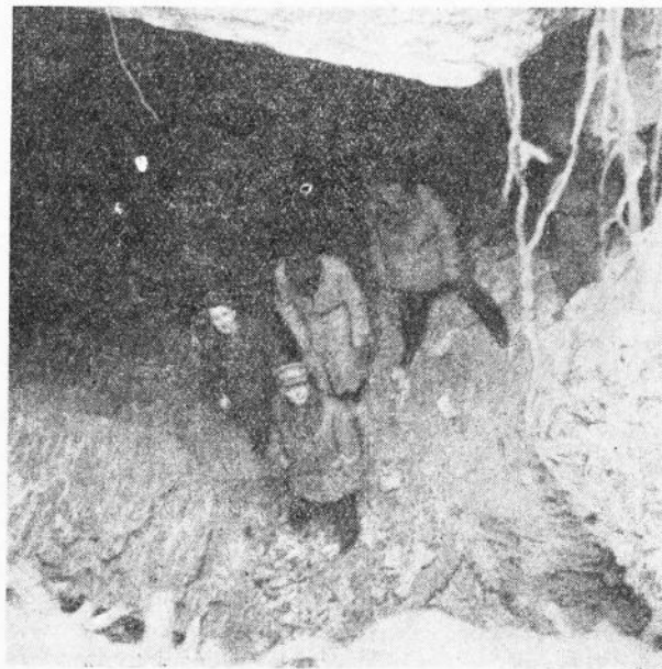
De overste van D.O.V.O. op bezoek