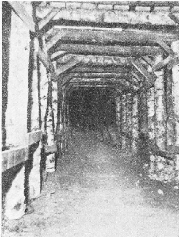
Een gaanderij, volmaakt mijnzicht.

plaatse dienen vernietigd. Wat een bewerkingen nog !