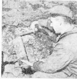
Een losgemaakte obus.

De volgende dagen nadat alle gevaar geweken scheen, werd alles stevig geschoord. En zonder verdere alarmgevingen werd het werk hernomen.