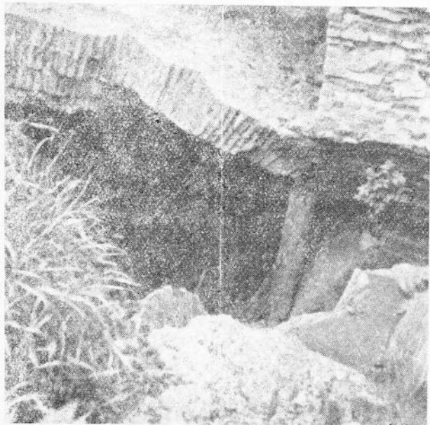
Ingang der werkplaats n° 2.

De vrijgekomen ruimte heeft gediend om de grond te bergen voortkomende van werplaats n° 2. Ze doende is de laatst overblijvende munitie bedolven en zou haar spontane ontploffing waarschijnlijk nauwelijks merkbaar zijn.