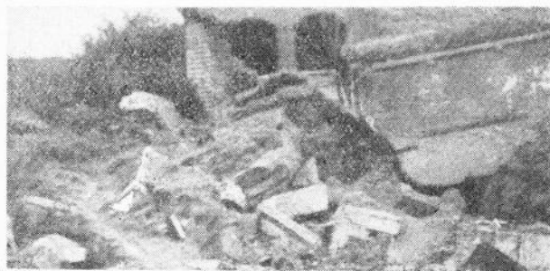
Talrijke instortingen versperden...

Van September 1946 tot de 5de April 1947 ruimde men er 200 ton allerlei obussen van 20 tot 105 mm. Twee diepzeebommen voor onderzeeërs (ladingen hexanite van 40 kg) voorzien van regelbare ontsteking op 10, 20, 40 en 60 seconden werden eveneens ontdekt.