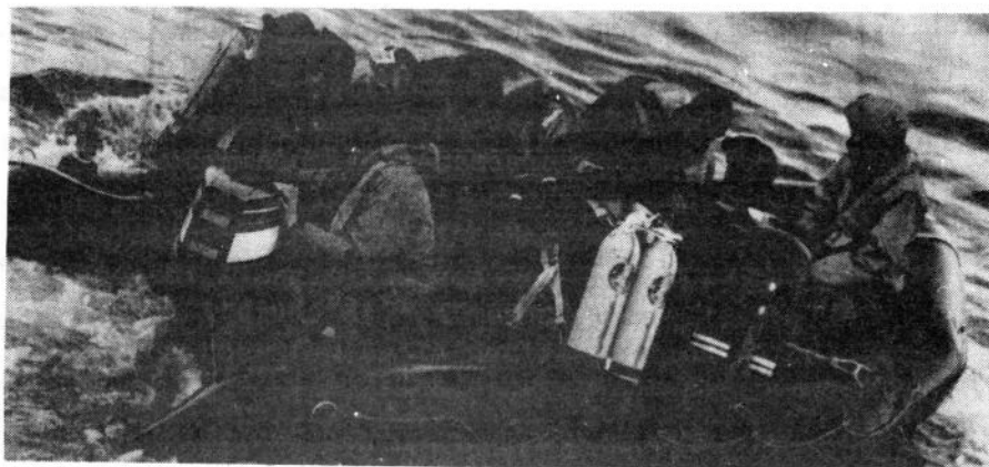
EXERCICE DE PLONGEE

Enfin de nombreuses travaux de routine, comme des inspections de coque ou l'enlèvement de câbles et filets de pêche pris dans les hélices des navires, sont exécutés régulièrement.