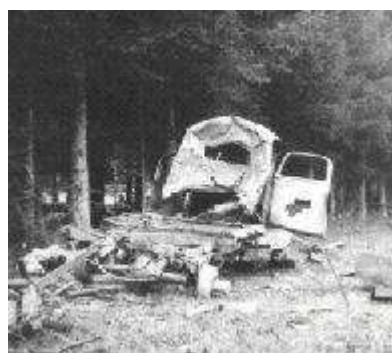
Ce qu'il reste du véhicule après l'explosion