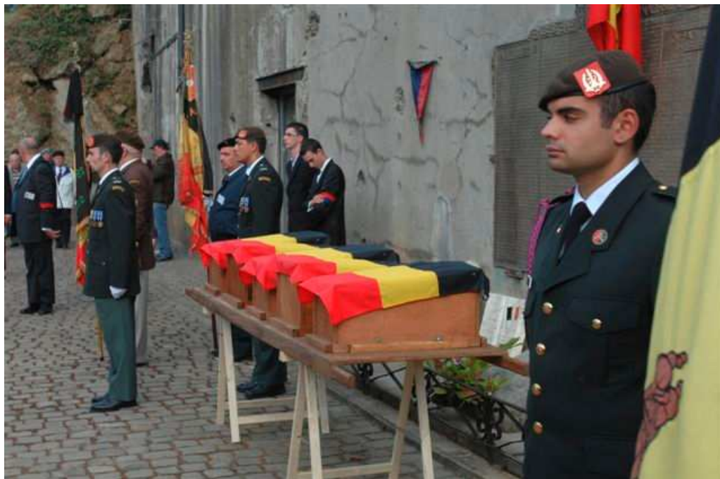
LONCIN 15 / 08 / 2008