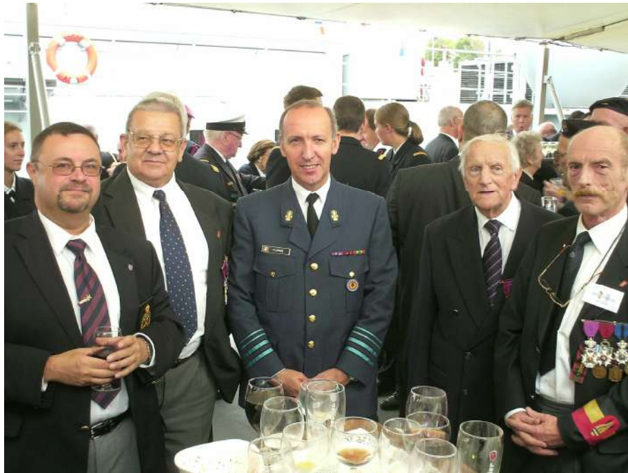
CENOTAPHE LONDON 13 / 07 / 2008