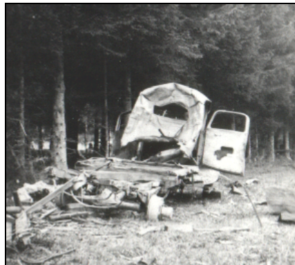
Trouvé dans les archives : le camion après l'explosion

Ce monument est difficile à repérer. Certains villageois ignorent même son existence. Il s'agit d'une croix de bois plantée sur une stèle de pierre sur laquelle on lit les noms des victimes.